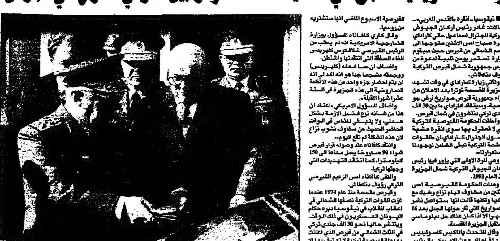
رئيس شمال قبرص نيكوس ديماسيس وقائد الجيش التركي الجنرال اسماعيل حنفي كراداي في مطار ليركيا (روتر)